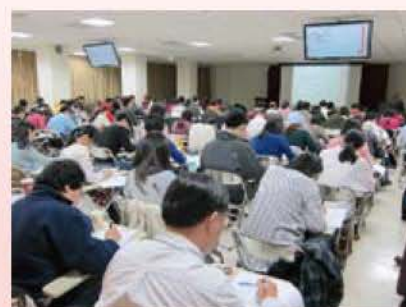
課程精彩中醫師研習熱烈