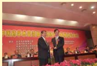
陳理事長代表本會致贈大會紀念獎牌