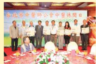
敬老聯誼餐會陳理事長頒發資深會員獎後合影