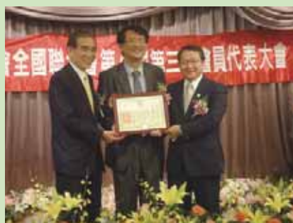
全聯會會員代表大會孫理事長、陳 監事長頒發百萬積分貢獻獎給公會