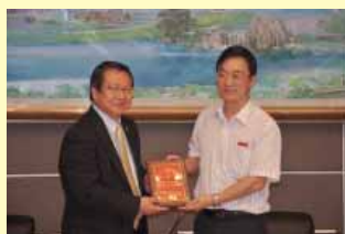
陳理事長致贈福建中醫藥大學紀念牌