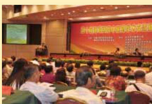
福州海峽兩岸交流大會會場出席盛況