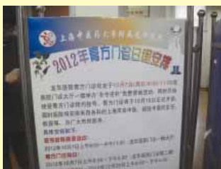
第四季是膏方門診時候龍華醫院今年估計配二三萬甕