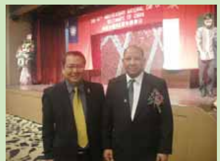
陳理事長應阿曼王國駐華代表之邀 參加其國慶日酒會