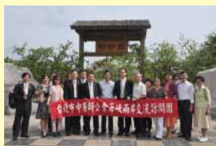
本會交流訪問團於時珍園門口合影