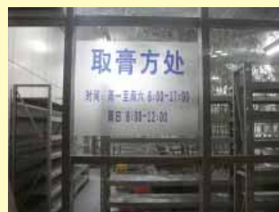
上海中醫藥大學附屬龍華醫院放置待取膏方的鐵架子