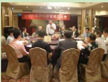
台灣中醫男科學會成立陳理事長談 台灣中醫男科願景