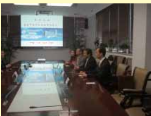
陳理事長等參訪上海中醫藥大學附屬龍華醫院聽簡報

下午前往上海國際會議中心參加上海中醫藥國際論壇，上海中醫藥國際論壇已邁入第五屆，2012年上海中醫藥國際論壇的大會主題為『中醫臨床、健康生活、國際化發展』，設立了四個專題論壇，分別為「中醫醫家思想研究與臨床實踐」、「民間特色診療技術及驗方研討」、「世界自然醫學實踐 - 脊柱健康保健」、「中醫藥防治慢病研究進展」四個專題，與會有來自國內外中醫專家，包括英、美、德及亞洲多國的專家，研討中醫藥在現代臨床的發展。