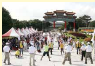
休閒日活動大會開幕式後舉行健康養生操