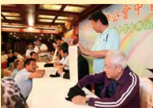
會員聚精會神進行按脈診字摸麻將測字活動