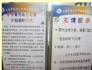
陶罐裝置的膏方久放容易發霉所以有真空定量小包裝