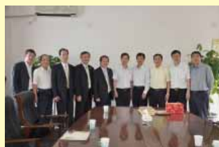
陳理事長等參訪附設醫院與院長合影