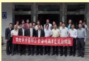
訪問團於福建中醫藥大學附設醫院前合影