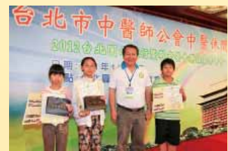
陳理事長代表大會表揚會員子女寫生比賽優勝