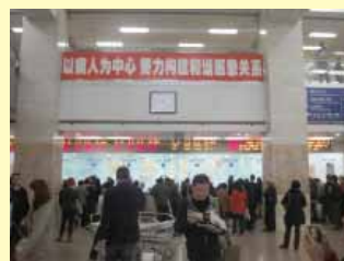
上海中醫藥大學附屬龍華醫院掛號大廳門庭若市人多