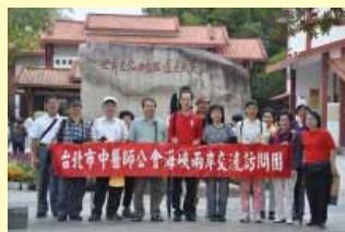
本會參訪團順道觀光世界文化自然遺產福建武夷山