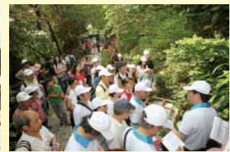
於圓山風景區舉辦本土藥用植物辨識研習課程