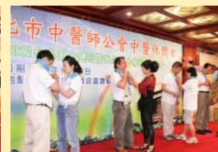
緊張刺激活動進行女人我最大幫先生打領帶競賽