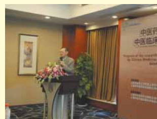
賴東淵教授演講中醫藥對放化療後患者體質改善的研究報告