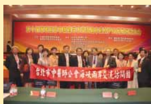
本會交流代表團全體團員於會場大合照