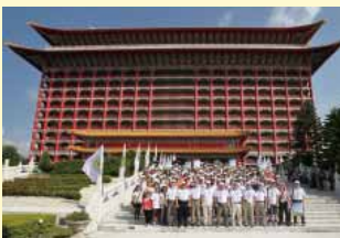
公會於圓山大飯店舉辦101年度中醫休閒日活動

感謝參與中醫休閒日的會員同道、家屬們，及各相關人員如理監事、公會工作人員、藥廠朋友等，你們的熱情投入，才讓本次活動能圓滿落幕。中醫休閒日已籌辦多年，此次活動是本屆理監事會籌辦的最後一次，接下來將由下屆理監事擔綱。至於中醫休閒日這否延續或轉型，敬請期待！！