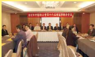
召開理監事會議本會歷屆理事長蒞臨指導(2012. 12. 02)