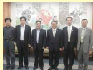
陳理事長等一行聽取簡報後與龍華醫院書記合影留念