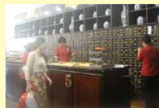
盛名的福州瑞來春堂精美藥局陳設及工作人員忙抓藥