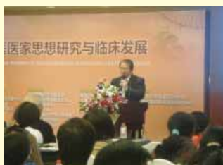
上海中醫藥國際論壇陳理事長講演頭痛中醫辨證論治