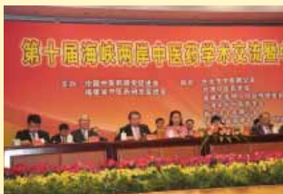
陳理事長應大會邀請代表台灣中醫界致詞

新校區的位置，若從碑文所記「環眺周遭，則鼓山左峙，崔巍蔥！，旗山右聳，青黛蒼茫，前橫烏龍江，若馳情濟世，奔湧入海，後枕溪源水，猶懸壺流祉，潺湲出壑」看來，寬廣的校區原來似為沼澤之地，建校伊始，想像從無到有的規劃宏模，建校過程中，掘土為湖，壘土為嶺的艱苦工程，到今天，「登茲亭，覽校園，畢見明湖蜿蜒，碧波泛漾，群樓儷陳，高下掩映」的現況，印證了前人種樹，後人乘涼的歷程，沒有完善的規劃，切實的執行，就不可能有令人欣賞的成果可以享受，更不可能有讓後人感念的豐碑可以立足了。