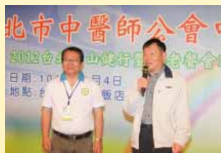
台北市政府衛生局林奇宏局長蒞臨致詞指導