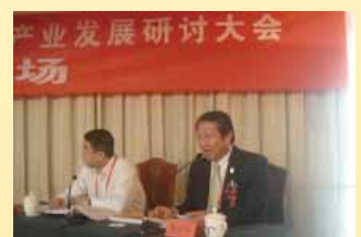
第十屆海峽兩岸中醫藥學術論壇陳理事長主持研討會