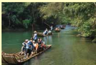
福建武夷山九曲溪搭乘竹筏漂流休閒之旅