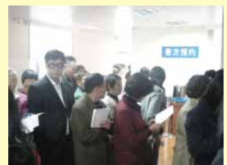
龍華醫院的治未病中心預約膏方門診的民眾相當之多