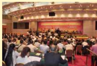
福州海峽兩岸中醫藥交流會出席熱烈