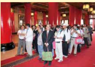
休閒日公會舉辦圓山大飯店古蹟導覽活動