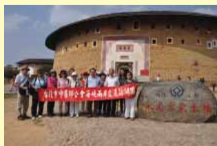
本會參訪團順道觀光世界文化自然遺產福建永定土樓