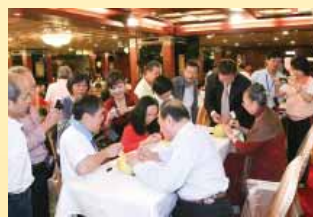
會員進行針刺柚子寫字展現針刺功夫比賽活動