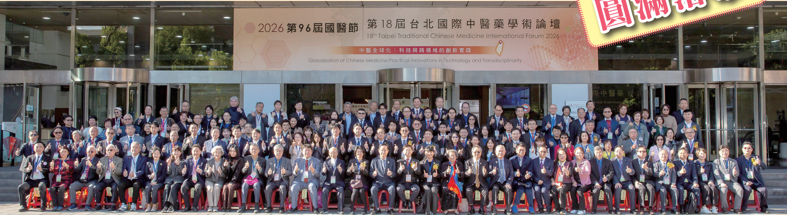
文 / 國醫節籌備委員會鄭宏足執行長