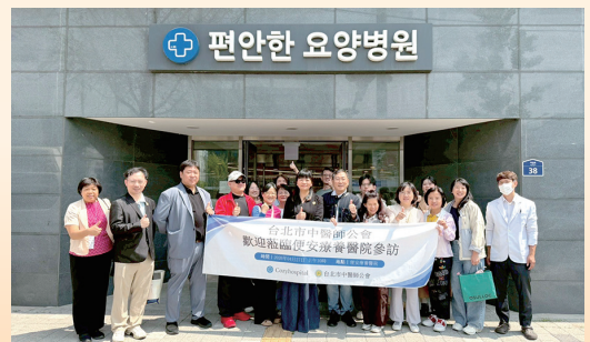
與便安療養醫院參訪交流