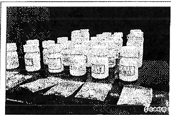
南檢查獲大批中藥偽藥，包羅萬象。

〔記者黃文鎧／台南報導〕台南地檢署查緝中藥偽藥，前日在全國同步出擊，查獲兩家生技公司及一家包裝廠製造中藥偽藥。檢方發現，三家公司涉嫌從九十九年起將來源不明中藥材壓錠、包裝，並以高出市價一成價格，賣給各地中醫診所，單單去年就有超過六公噸偽中藥流入市面，由於藥品成分不明，恐怕對服用患者造成傷害。