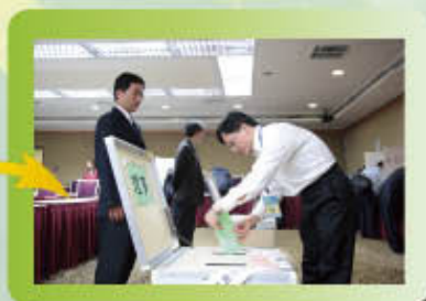
▲每一票箱皆有監票服務人員協助投票作業。