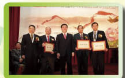
990314 台北市中醫師公會創會 60 週年慶祝大會邀請台北市長郝龍斌、衛生局長邱文祥、中醫師公會全聯會名譽理事長巫水生代表大會，頒發中醫奉獻獎(左圖)、資深中醫師獎(中圖)、學術成就獎(右圖)。