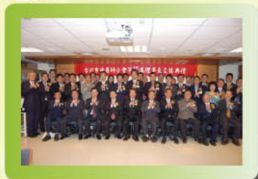
▲ 99.03.17 第 16 屆理監事就職後合影