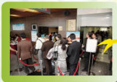
▲會員依序排隊等候辦理報到。