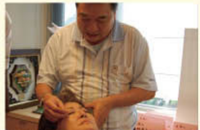
丘應生教授於研討會講解針灸手法