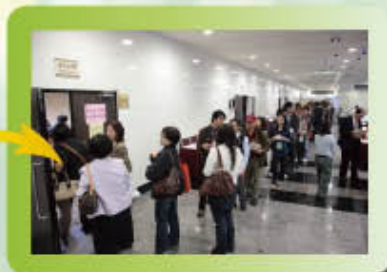
▲投票前持選票交換證依序排隊。