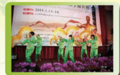
990314 於台大醫院國際會議中心 201 大會廳舉辦台北市中醫師公會創會 60 週年聯歡晚會，晚會表演節目有台北縣中醫師公會贊助舞獅表演(右圖)、原住民舞蹈表演(中圖)、本會健身舞蹈社曼妙歌舞(左圖)及北一女中街舞及會員佛朗明哥表演等。