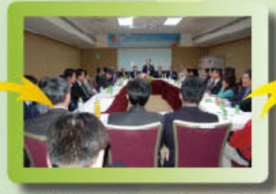
▲開票後即召開第一次理監事聯席會議。