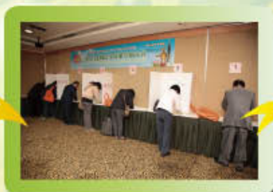
▲於票區圈選心目中理想的理監事人選。