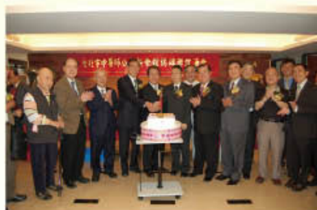
▲ 990516 新會館落成週年，公會歷任理事長與資深會員一同切蛋糕祝賀青島西路新會館落成週年

本會於公元一九五〇年成立，會址每隨歷任理事長播遷。改制後第三屆理事長張正懋醫師，感念公會無固定會所，共募款柒拾餘萬元，購得紹興南街 14 之 1 號之會館，並於一九七三年二月五日落成。由於會員人數激增，會務加重，開會時場地狹窄。一九九二年第十屆理事長林昭庚教授，發動全體理監事及會員踴躍捐款，各中醫醫院藥廠及社會人士熱心贊助，加上出售紹興南街舊會館所得，共籌得壹仟伍佰陸拾陸萬元購置廣州街 32 號 7 樓的會館，廣州街會館於一九九三年三月十七日落成啟用。公會在林昭庚理事長、鄭歲宗理事長、陳俊明理事長、陳旺全理事長及施純全理事長等大力推展會務下，會務蒸蒸日上，會館不敷使用。陳潮宗醫師於二〇〇七年三月當選第十五屆理事長，為推動公會全球化及提升公會良好形象，會館需要要有足夠的空間，以辦理課程及接待外賓，遂於第十五屆第二次會員大會通過更新會館；經出售廣州街會館壹仟陸佰參拾萬元，及提撥會務發展基金貳仟零柒拾萬元，合計參仟柒佰萬元，購置位於台北市五鐵共構區與中央行政中心之青島西路 11 號 3 樓國會公園大廈，經理監事、會員、協力廠商，與友會團體鼎力支持，熱烈捐款捌佰伍拾捌萬元，更新會館裝潢及設備，二〇〇九年五月十七日舉行新會館落成啟用典禮。由於新會館地點適中、交通便利、寬敞舒適、設備新穎，為一極佳之辦公集會及提供會員服務之場所。感於公會創業之維艱，本會第十六屆理事長陳志芳醫師除將歷次購置會館熱心捐款者芳名，鐫刻留鴻外，並敬撰會館興建誌，以資永久紀念。