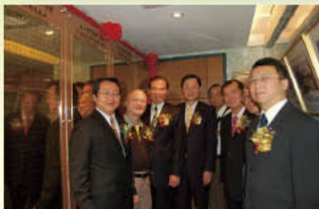
▲ 990516 公會歷次會館興建捐款名錄及沿革碑誌揭碑儀式在歷任理事長及現任理事長揭碑後合影