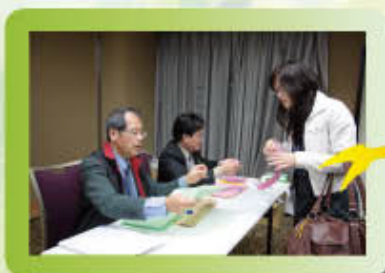
▲憑選票交換證及身分證向發票人領取選票。