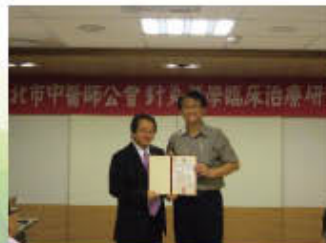
▲孫茂峰教授(右)應邀於 針灸研討會專題演講