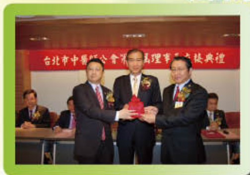
▲ 99.03.17 新卸任理事長交接典禮