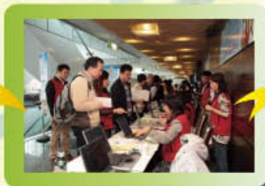
▲會員領取出席證及選票交換證。