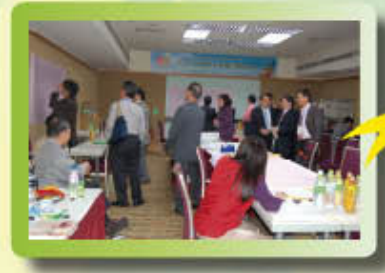
▲大會當天分五個投票所開票、唱票、記票作業。