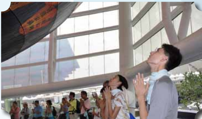
▲公會參訪團一行於台灣館天燈前共同為中醫的願景祈福