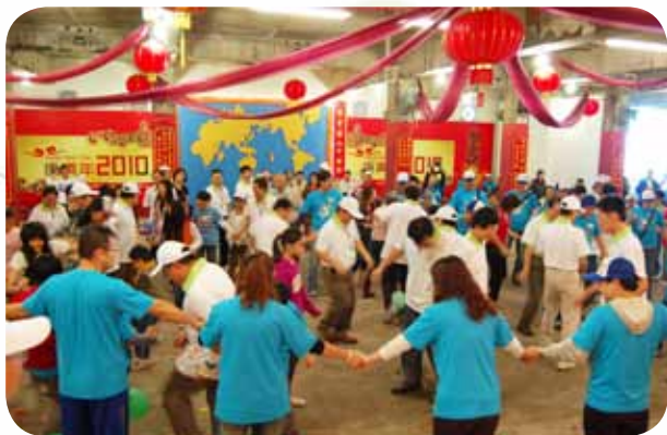
▲熱鬧精彩的踩汽球活動