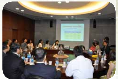
▲本會參訪團上海曙光醫院交流座談會