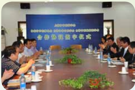
▲本會代表團與上海中醫藥學會代表座談交流