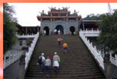
▲指南宮登山健行活動