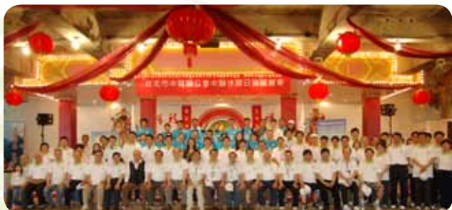
▲中醫休閒日活動全體理監事及工作人員合影