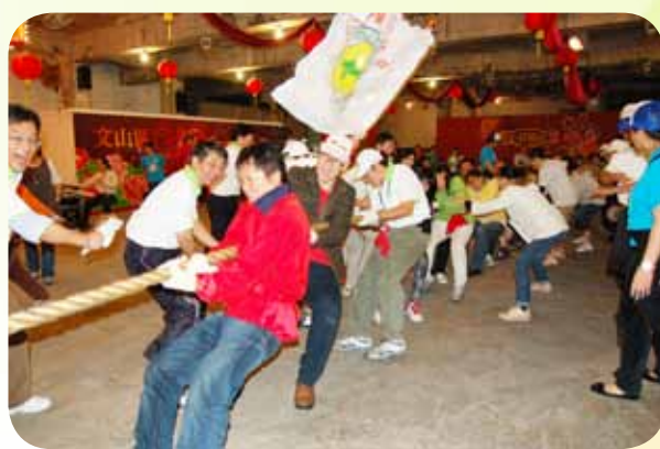
▲休閒日最精彩激烈的拔河比賽