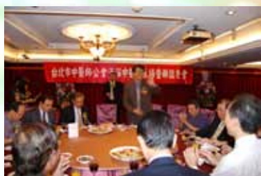
▲重陽節敬老餐會出席熱烈

· 歡迎同道踴躍報名參加各種聯誼活動比賽，欲參加者，報名專線：2314-3456