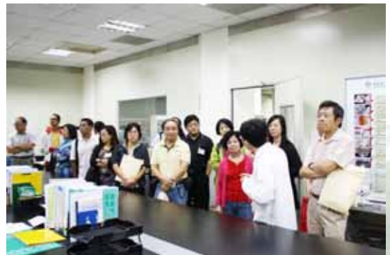
▲科達製藥廠為會員介紹 GMP 製造流程