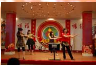
▲健身舞蹈社於中醫休閒日活動表演