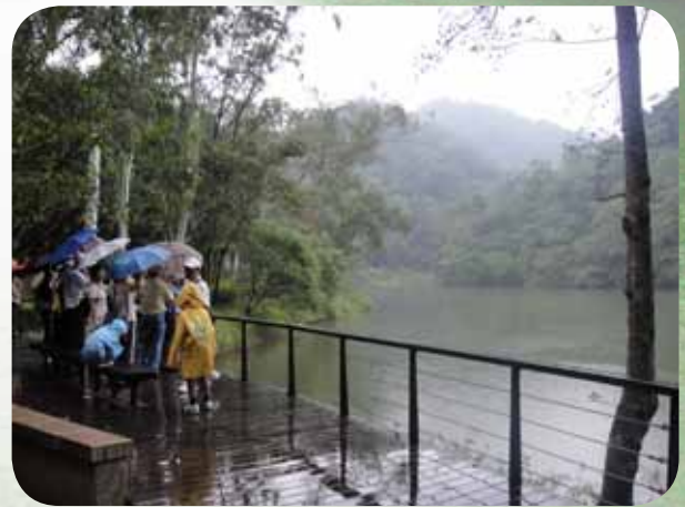
▲微風細雨的後慈湖寧靜神秘中別有一番風味