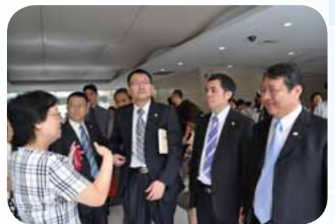
▲本會參訪團參觀醫院由各科主任親自介紹