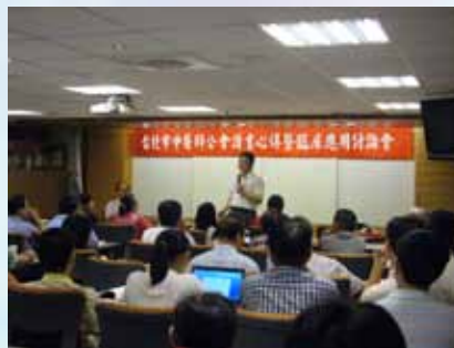
▲會員踴躍出席讀書會