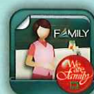
中國信託行動銀行 Home Bank