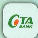
三信行動Plus (三信商銀)